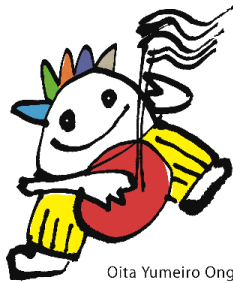
Oita Yumeiro Ongakusai

おおいた夢色音楽祭実行委員会 〒870-0035 大分市中央町1丁目3-12 大一マートビル3階 TEL : 097-513-4280 FAX : 097-513-4281 HP: https://www.yumeon.jp